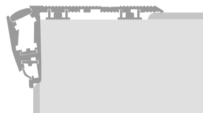
Wariant z dystansem pod wykładzinę